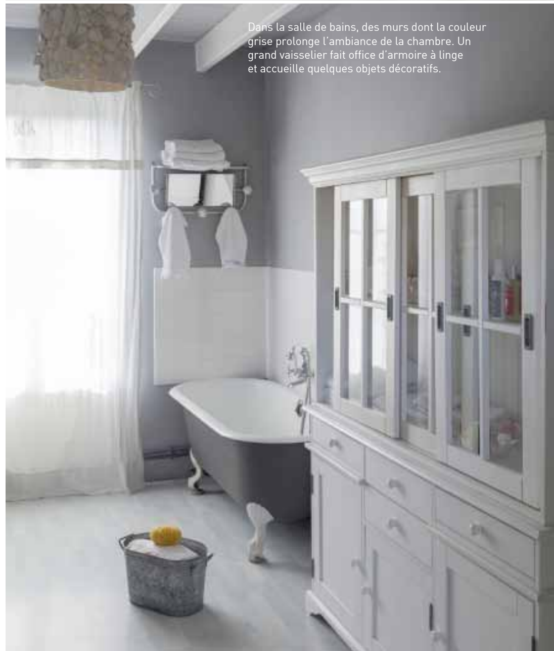
Dans la salle de bains, des murs dont la couleur grise prolonge l'ambiance de la chambre. Un grand vaisselier fait office d'armoire à linge et accueille quelques objets décoratifs.