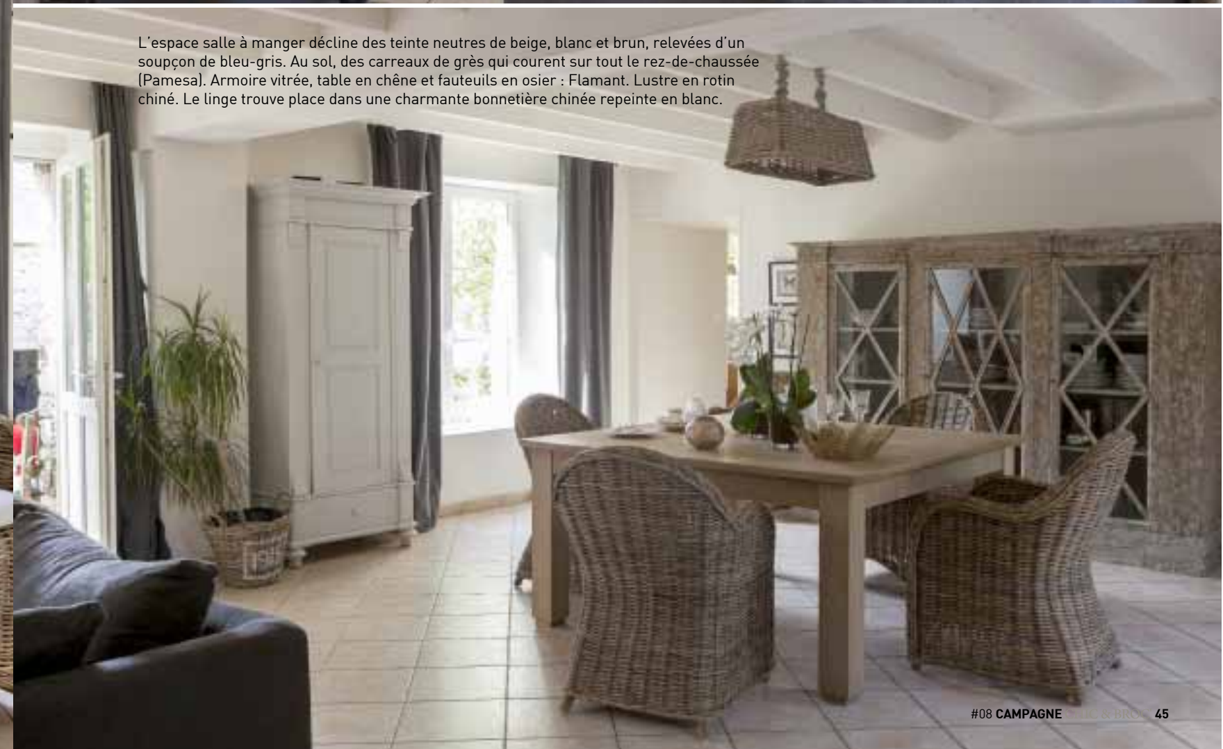
L'espace salle à manger décline des teintes neutres de beige, blanc et brun, relevées d'un soupçon de bleu-gris. Au sol, des carreaux de grès qui courent sur tout le rez-de-chaussée (Pamesa). Armoire vitrée, table en chêne et fauteuils en osier : Flamant. Lustre en rotin chiné. Le linge trouve place dans une charmante bonnettière chinée repeinte en blanc.