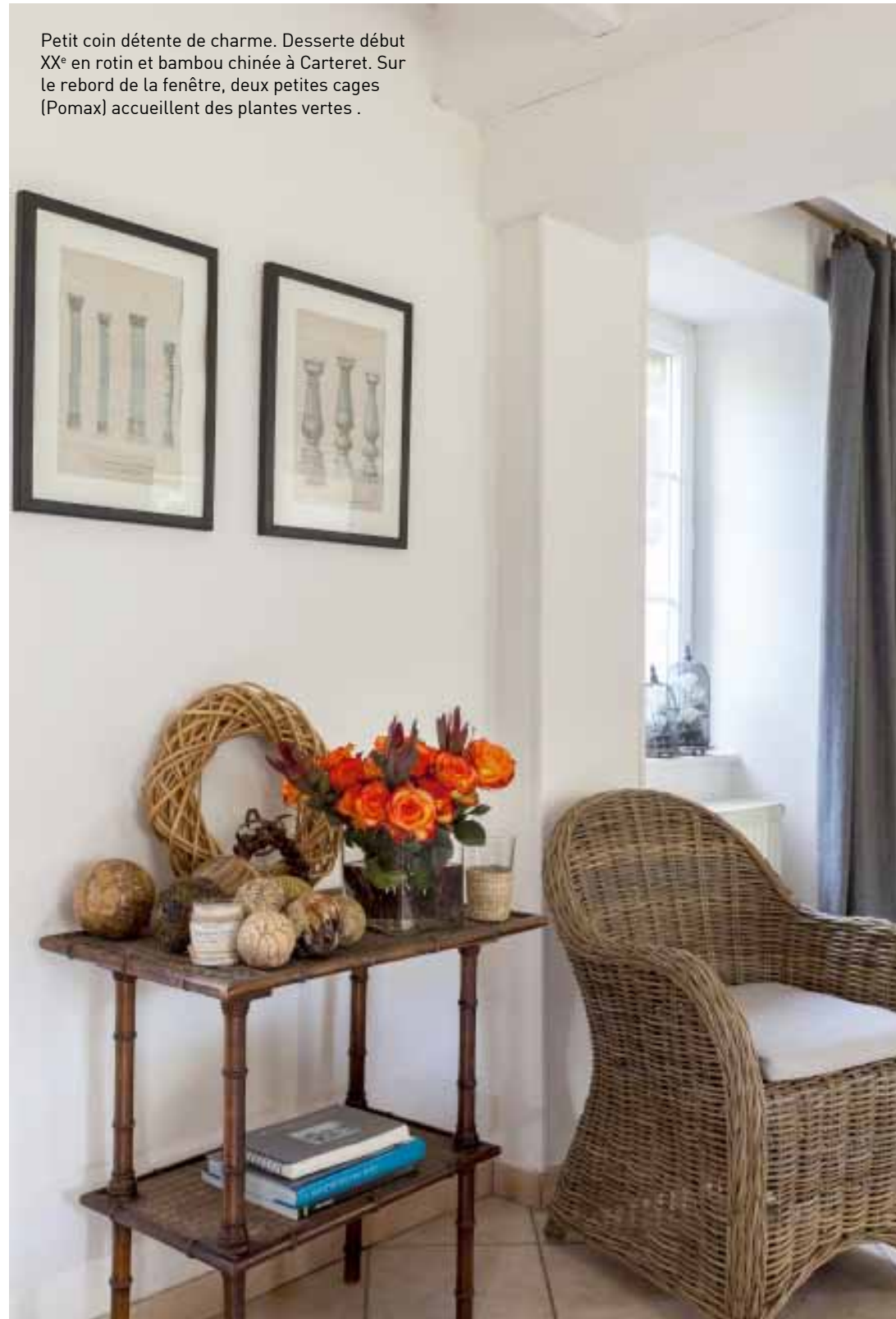
Petit coin détente de charme. Desserte début XX e en rotin et bambou chinée à Carteret. Sur le rebord de la fenêtre, deux petites cages (Pomax) accueillent des plantes vertes.

Sérénité et douceur règnent sur le salon où l'harmonie des couleurs est superbement mise en valeur.