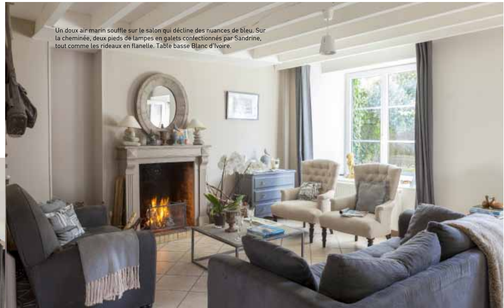
Un doux air marin souffle sur le salon qui décline des nuances de bleu. Sur la cheminée, deux pieds de lampes en galets confectionnés par Sandrine, tout comme les rideaux en flanelle. Table basse Blanc d'Ivoire.